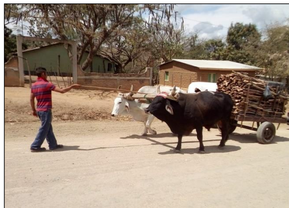
Figura 3. Transporte de Leña, Comunidad de El Naranjal